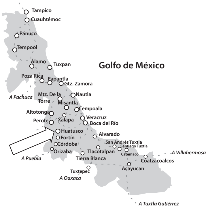
Mapa 1 MAPA DE VERACRUZ CON UBICACIÓN DE HUATUSCO

a la esposa o madre del migrante retornado), y al delegado municipal. En Comapa se habló en Boca del Monte con el delegado y cuatro retornados. En total fueron 17 informantes. También se entrevistó al presidente de la Unión de Pequeños Productores de Café de Huatusco y al doctor Esteban Escamilla del Centro Regional Universitario Oriente de Chapingo (CRUO) en Huatusco, experto en producción de café, así como al gerente de la Caja Popular Yanga, empresa con influencia financiera en la región. Se trata de un estudio cualitativo de carácter preliminar, por lo que no se pueden generalizar sus conclusiones.